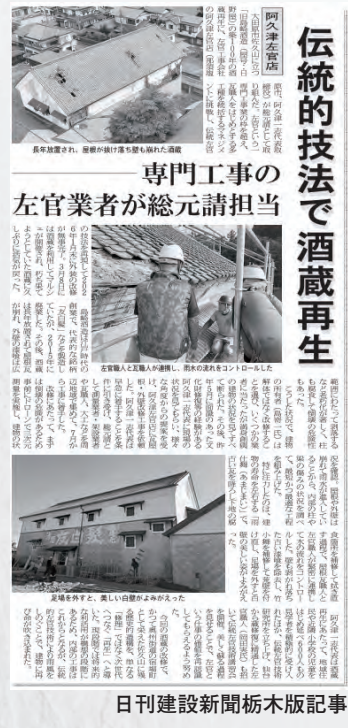
日刊建設新聞栃木版記事