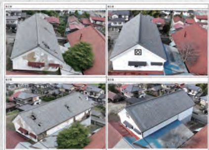
酒蔵再生ビフォーアフター