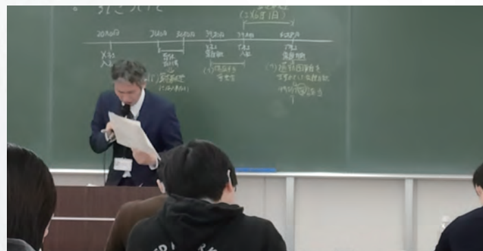
社労士による講習会風景