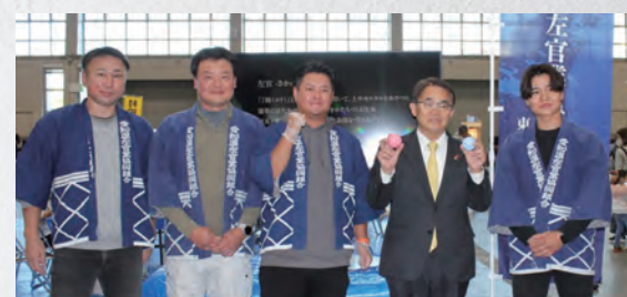
技能プラザ開催時左官コーナー、大村知事来訪。