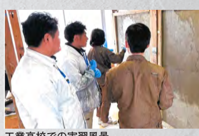
工業高校での実習風景