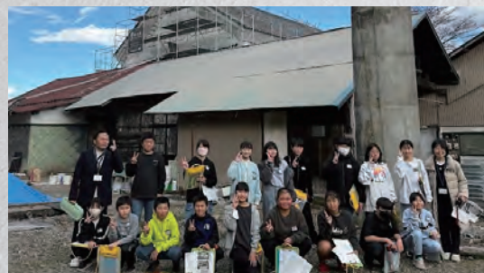
地元の小学生を招いて酒蔵再生の現場見学会他見学者延べ600名

この活動はSNSや新聞・専門誌等で注目され、工事期間中の見学者は延べ600名を超えました。さらに2026年3月8日、再生した酒蔵で開催されたマルシェには約700名が来場。真っ白な漆喰壁として蘇った酒蔵は、再び地域の誇りあるシンボルとなりました。本プロジェクトは、左官が地域の価値を救う「主役」になれることを証明し、職人を「子供たちの憧れ」へと昇華させる全国的な模範事例といえます。