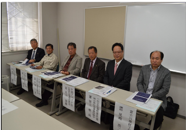
中国ブロック会役員の方々