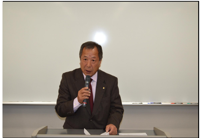
中国ブロック会丸山会長の開会の挨拶